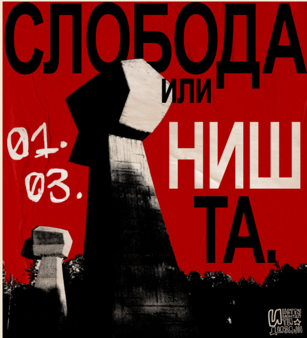
Инструменталити Дизајн, @instrumentaliti777