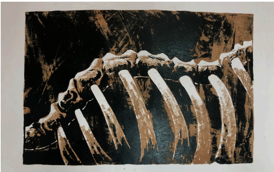
Ђорђе Марковић, графике рађене техником ланорез и алграфија