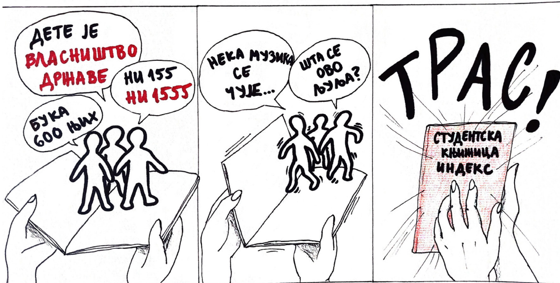
цртеж, Соња М.