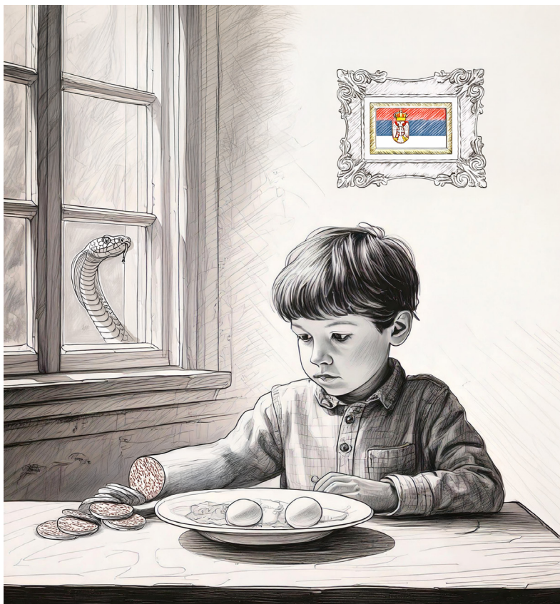
Србија, илустрација Драгана С.