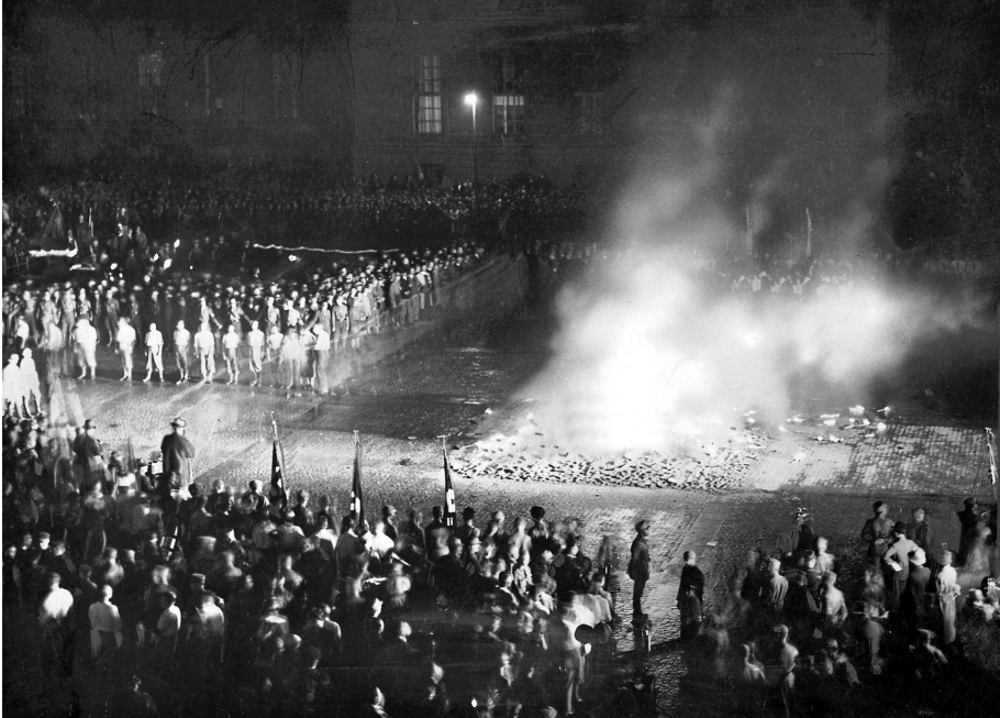
Фотографија 2: Спаљивање књига у Берлину 10. маја 1933.

периоду од 1933. до 1945. године, одржао је говор у коме наводи да Немац више неће бити човек од књиге, већ пре свега од карактера и да је доба јеврејског интелектуализма завршено. Ауторе ових дела назива „интелектуалном прљавштином”. Данас у Берлину постоји споменик тада спаљеним књигама. Организована су и спаљивања дела норвешког писца Кнута Хамсуна, али из другачијих побуда.