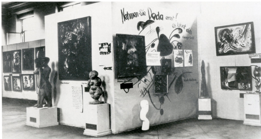
Фотографија 1: Изложба Entartete Kunst 1937.

Клеа, Кирхнера, Хекела, Нолдеа и других. Био је занимљив случај Емила Нолдеа, који је подржавао нацисте и сматрао себе једним од њих. Мрзео је Јевреје, обожавао Хитлера, па ипак, то није успело да спасе његову уметност, чак му је било забрањено да поседује било какав сликарски материјал и прибор. Након Хитлерових увреда, Нолде га је и даље обожавао, а након рата остао је нациста.