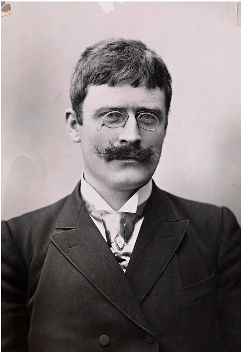
Фотографија 3: Кнут Хамсун

Достојевског и Ничеа. Стекао је славу и ширу популарност својим романом Глад из 1890. године, доневши у норвешку књижевност талас неореализма. Био је вољен и поштован у својој земљи. У овом роману Кнут тематизује различите врсте глади које се појављују у људској природи: глад друштва за моралом, глад за љубављу, религијом и основну, физичку глад. Протагониста романа је изгладнели писац који на улицама Кристианије (стари назив за Осло) тражи посао, да би платио кирију (утицај романа Достојевског Злочин и казна). Протагониста долази у све растројенија стања која узрокује његова глад, али је сувише поносан да би примио милостињу. Срећан је једино у тренуцима инспирације или при сусретима са девојком која му се допада. У норвешком друштву не цени се интелектуалност, квалитет и таленат, већ практичност, и он схвата да у таквом друштву нема места за њега. Истоимени филм режисера Хенинга Карлсена из 1966. године важи за једну од најбољих филмских адаптација књиге.